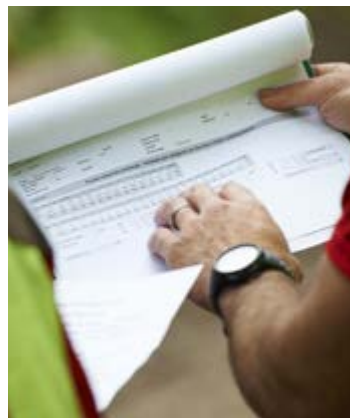
Vorarbeiter sind für einen grossen Teil der Arbeitsorganisation zuständig.