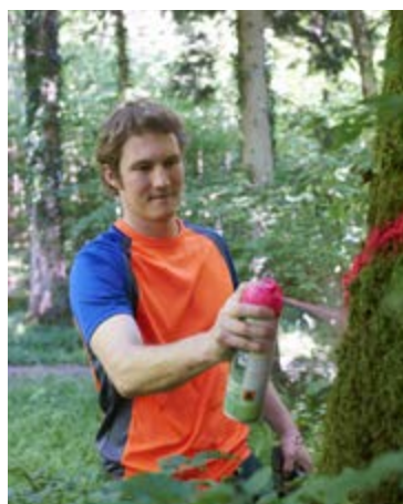
Der Förster entscheidet, welche Bäume gefällt werden.