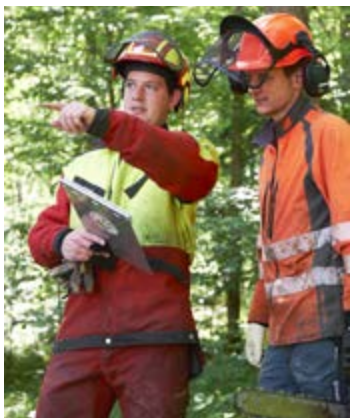
Ein Gruppenleiter weist einem Forstwart die Arbeit zu.