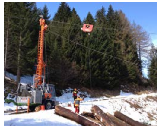
Im Gebirge werden gefällte Bäume mithilfe von Seilkrananlagen an den Lagerplatz transportiert.